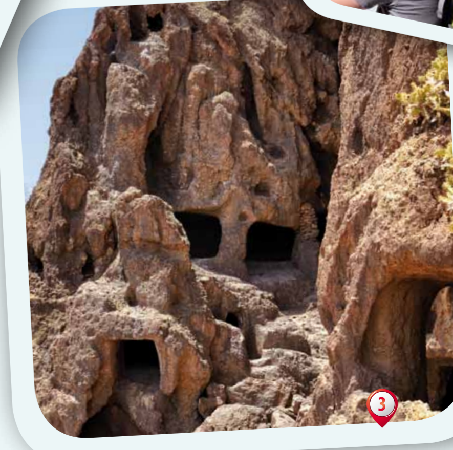
3. Yacimiento de Cuatro Puertas