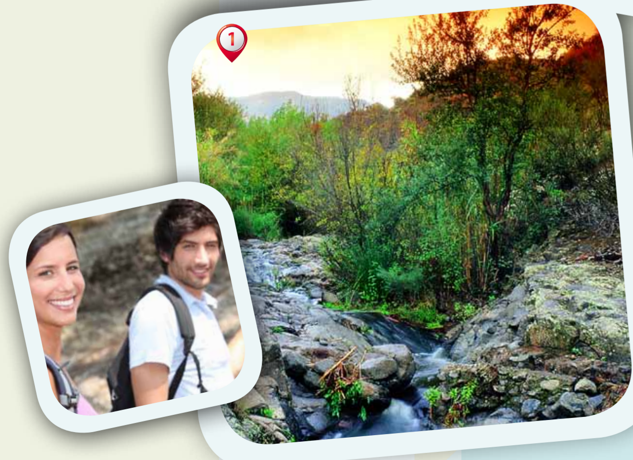
1. Barranco de los Cernicalos