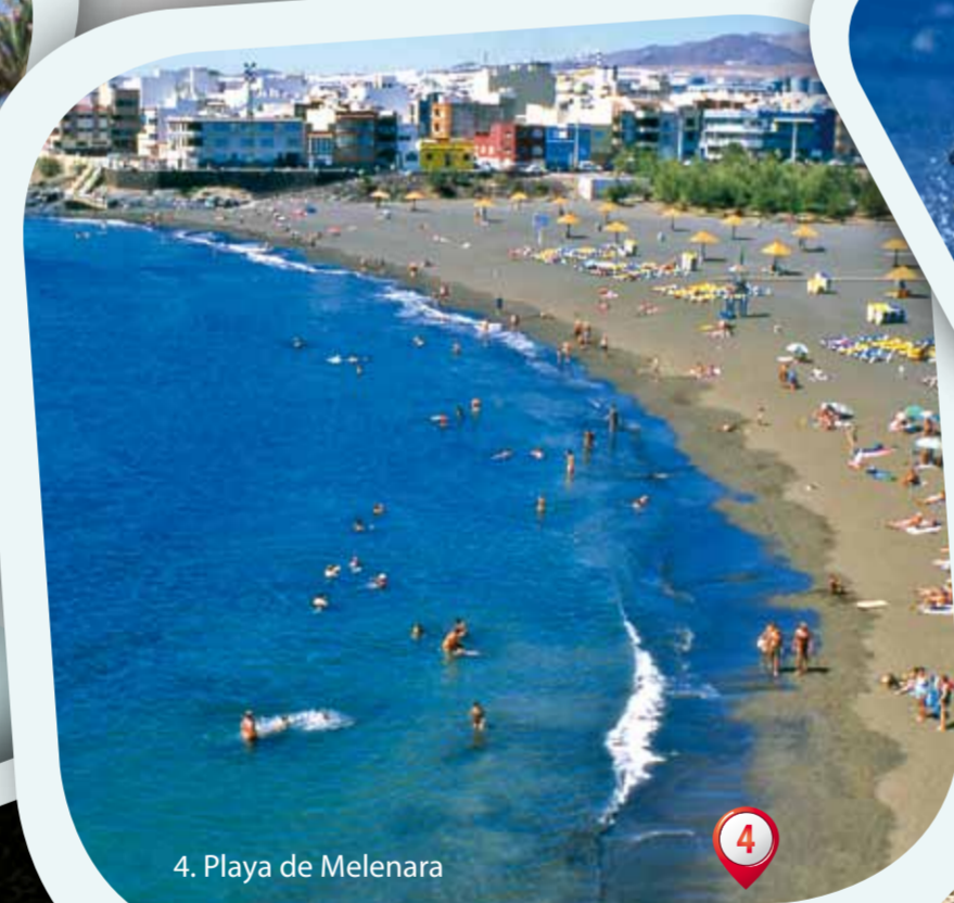
4. Playa de Melenara