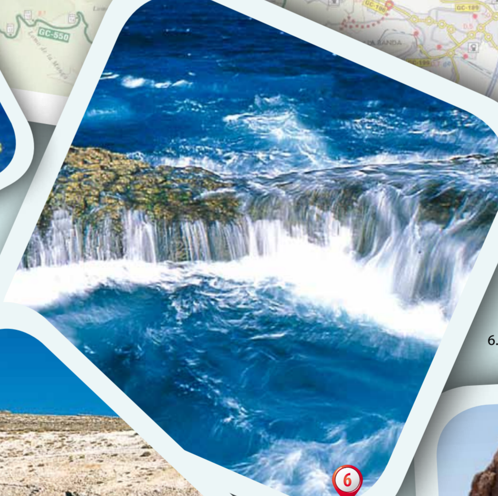
6. Bufadero de La Garita