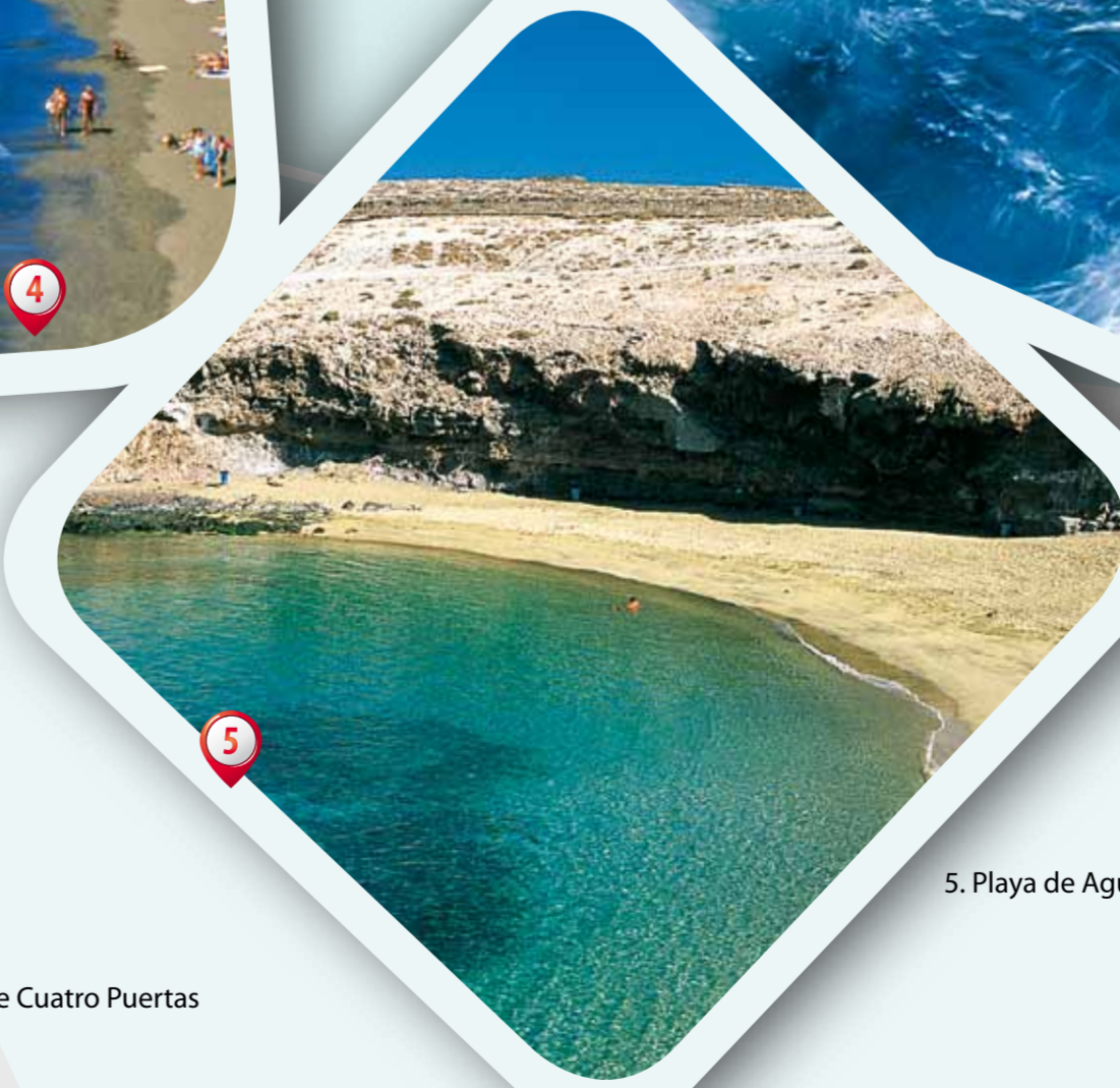
5. Playa de Aguadulce