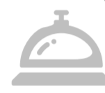
2. El Cortijo Club de Campo